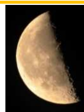
下弦の月 (月齢 22.2)

請求記号 383/ア 『どぶろくと女 日本女性飲酒考』 新宿書房 請求記号 387/イ 『日待・月待・庚申待』 人文書院 請求記号 440/テ 『天文年鑑 2024年版』 誠文堂新光社 請求記号 H718/セ 『石佛 東松山市石造記念物調査報告』 東松山市 請求記号 R718/ニ 『日本石仏図典』 国書刊行会