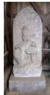
如意輪観音像 (大谷)