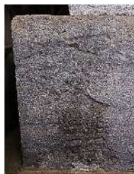
台座の「女人講中」の金石文

今年の11月の月例暦では9日が「上弦の月」、23日が「下弦の月」になります。ご馳走を用意して23日の真夜中の下弦の月を待ちますか。ちなみに二十三夜は勢至菩薩の縁日です。