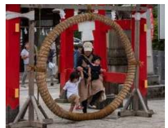
茅の輪くぐり (箭弓稲荷神社・6/30)

請求番号 H211/七 東松山市史資料編第5巻民俗編 東松山市 請求番号 386/イ 市田ひろみの年中行事とききたり 主婦と生活社 請求番号 387/カ 牛頭天皇と蘇民将来伝説 消された鬼神たち 作品社