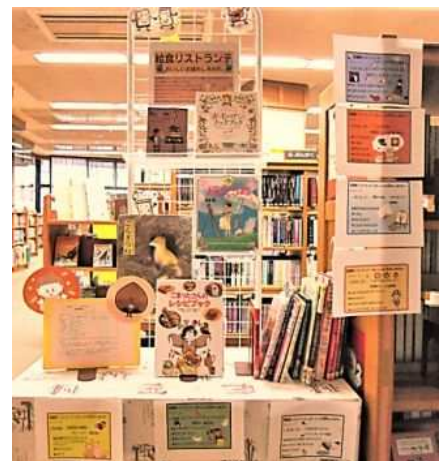
市立図書館の「図書館レストラン」展示

今年は、市立図書館も参加します。テーマ本コーナーで図書館レストランの図書の展示を行います。また、同コーナーでは、給食センターの栄養教諭が考えた「栗ご飯」のレシピも紹介します。ぜひレシピを手に入れて、物語に登場するごちそうを家で味わってみてください。