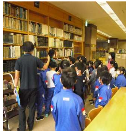
図書館見学の様子

また、一つのテーマで本を紹介するブックトークも行っています。物語の見どころを紹介したり、途中まで読み聞かせしたりするので、子ども達の読書へのハードルが低くなります。今年度は、新宿小学校で『図書館リストランテ おいしいお話めしあがれ』をテーマに『オムライス ヘイ！』など9冊の本を紹介しました。子ども達から「気になる、読んでみたい！」という声が上がりました。