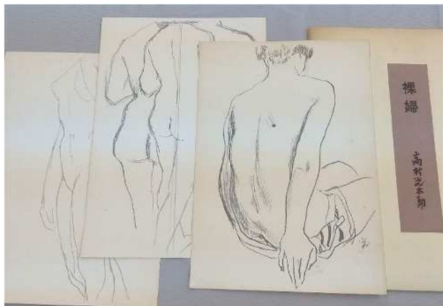
左から「乙女の像」の素描2点と「ほくろ」の素描。