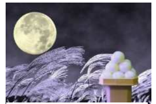
お月見のイメージ

十五夜の日ちょっと昔の東松山市では、ススキ(尾花)を5本と十五夜花(萩や葛、撫子などの秋の七草)を山や堤から採ってきて飾ったようです。月見ダンゴ15個か月見まんじゅう15個を重箱か一升餅に盛り、里芋、柿、栗、梨、サツマイモなどの丸いものを5個づつか15個を箕に入れてお月様にお供えしていたそうです。