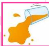
水や飲み物などによる 濡れ・汚れ