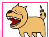
ペットの噛みあと